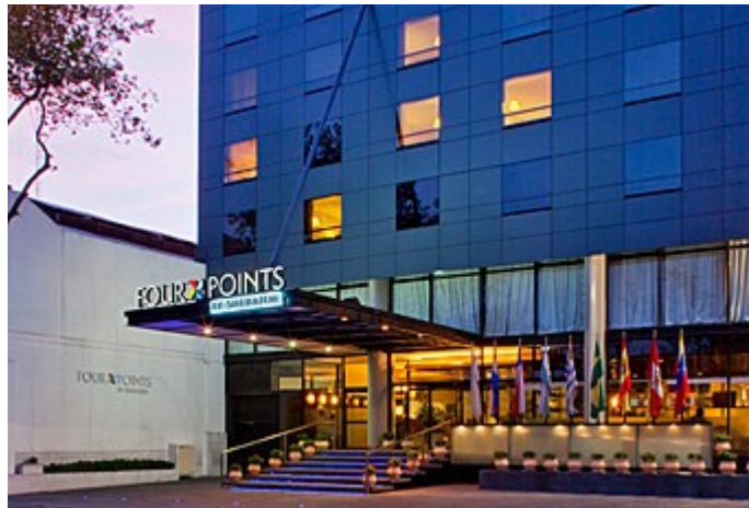
Figura 1. Fachada del hotel (imagen obtenida de su página web http://www.starwoodhotels.com/fourpoints/property/overview/index.html?propertyID=1576 )

Las reuniones técnicas, ejecutivas, de comunicaciones y de capacitación correspondientes al segundo semestre de 2011 de l proyecto ALICE2 y RedCLARA, se llevarán a cabo entre los días 7 y 11 de noviembre del año en curso en la ciudad de Montevideo, Uruguay. Todas las sesiones, incluso el curso de capacitación técnica, serán realizadas en las instalaciones del hotel Four Points. RAU, Red Académica Uruguaya, es anfitrión de este encuentro.