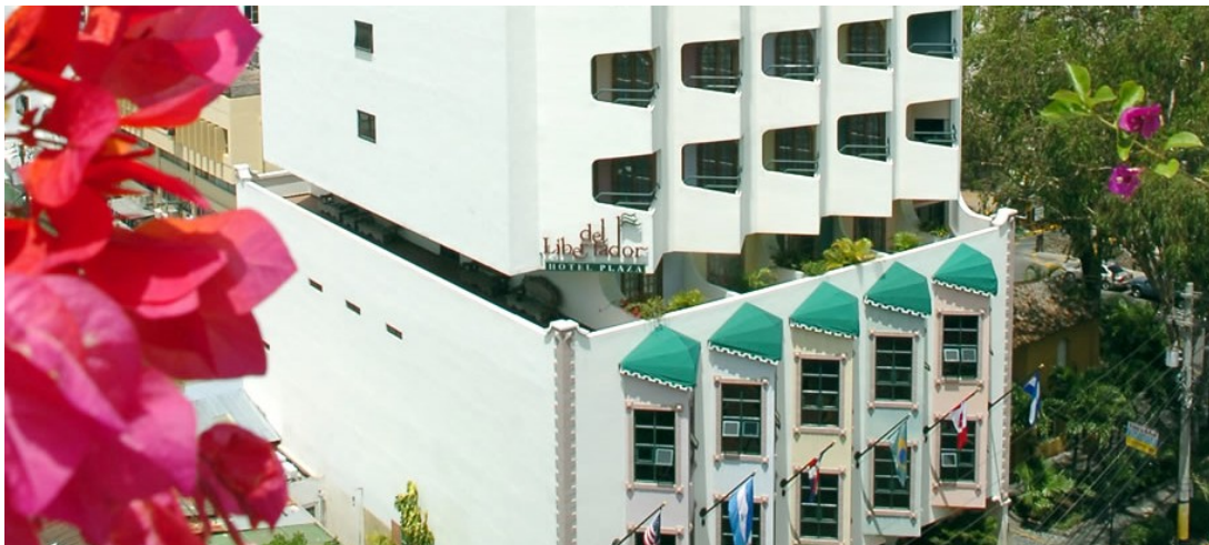
Figura 2. Entrada del Hotel Plaza del Libertador

favor, tenemos hasta el lunes 6 de junio para hacerlo. Después de esa fecha no se puede garantizar ni el precio ni la disponibilidad.