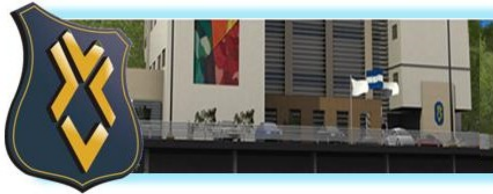
Figura 1. Entrada al pabellón nuevo de la universidad

Se realizarán del 20 al 24 de Junio en las instalaciones de la Universidad José Cecilio del Valle < http://www.ujcv.edu.hn/ > en Tegucigalpa, Honduras.