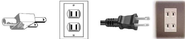
Figura 3. Clavija tipo A

110 voltios a 60Hz con clavijas tipo A y B