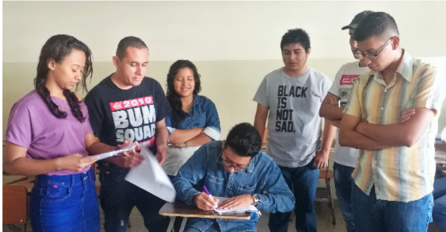
Figura 3. Estudiantes de la asignatura Métodos y Técnicas de Investigación desarrollando trabajo colaborativo en el aula.

Aproximadamente, el 80% de los estudiantes expresó que consideraba apropiada la metodología que se estaba implementando en las clases, por ser algo fuera de lo común. También calificaron como positivo el hecho que en el momento de la clase se realizaran las sugerencias respecto a los avances de investigación, ya que de esa manera ellos se sentían más seguros al momento de disponerse a completar la actividad.