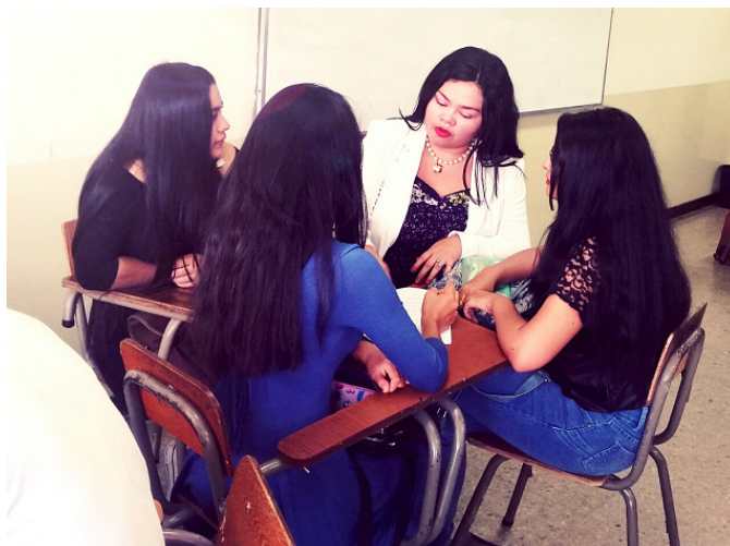
Figura 5. Docente orientando a los equipos de investigación en el avance de sus productos en el aula.