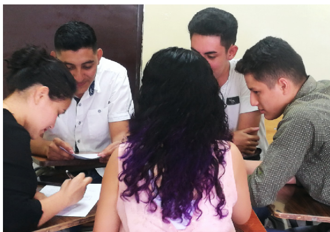
Figura 6. Estudiantes realizando el proceso de coevaluación.

En cuanto a este punto, cada uno de los estudiantes tomó de manera positiva esta experiencia. El instrumento de coevaluación fue firmado por el miembro del equipo que fue evaluado, con el propósito que confirmaba que la evaluación hecha había sido aceptada por él. La actitud positiva de todos los estudiantes fue sorprendente, ya que ninguno generó una actitud de rechazo; al contrario,