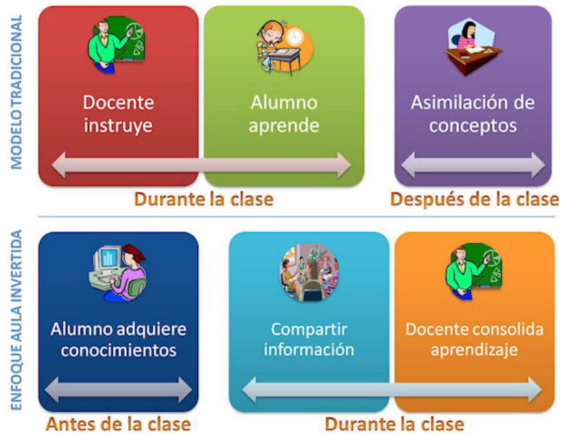
Figura 2. Modelo tradicional versus enfoque aula invertida.