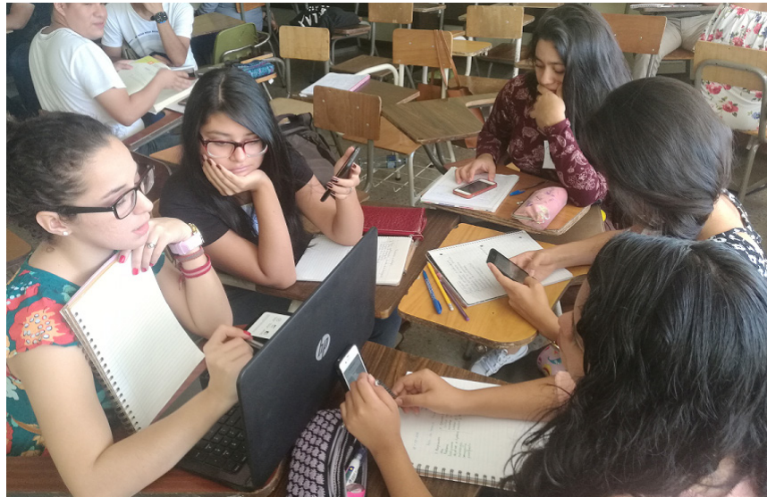
Figura 4. Estudiantes utilizando sus smartphones con el propósito de obtener insumos en la construcción de su investigación.

se a través de la red wifi de la Universidad. Justo en este punto se generó la limitante mayor de la investigación, donde no todos podían conectarse a la red. Ésta situación generó el hecho de dejar el estudio y búsqueda de información exclusivamente fuera del aula.